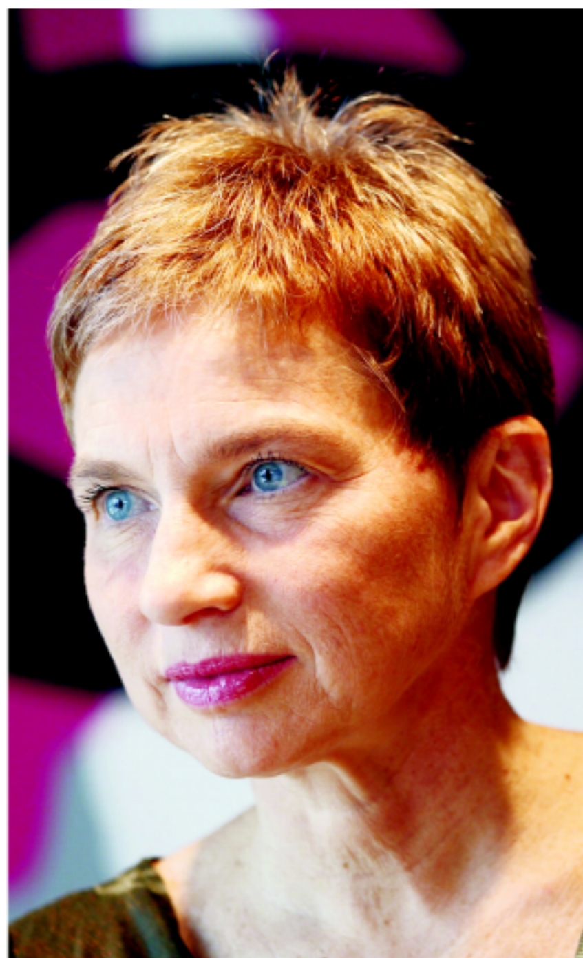
SIÈGE DU MEDEF (PARIS VIP), LE 22 JUIN. La présidente du syndicat patronal juge qu'il