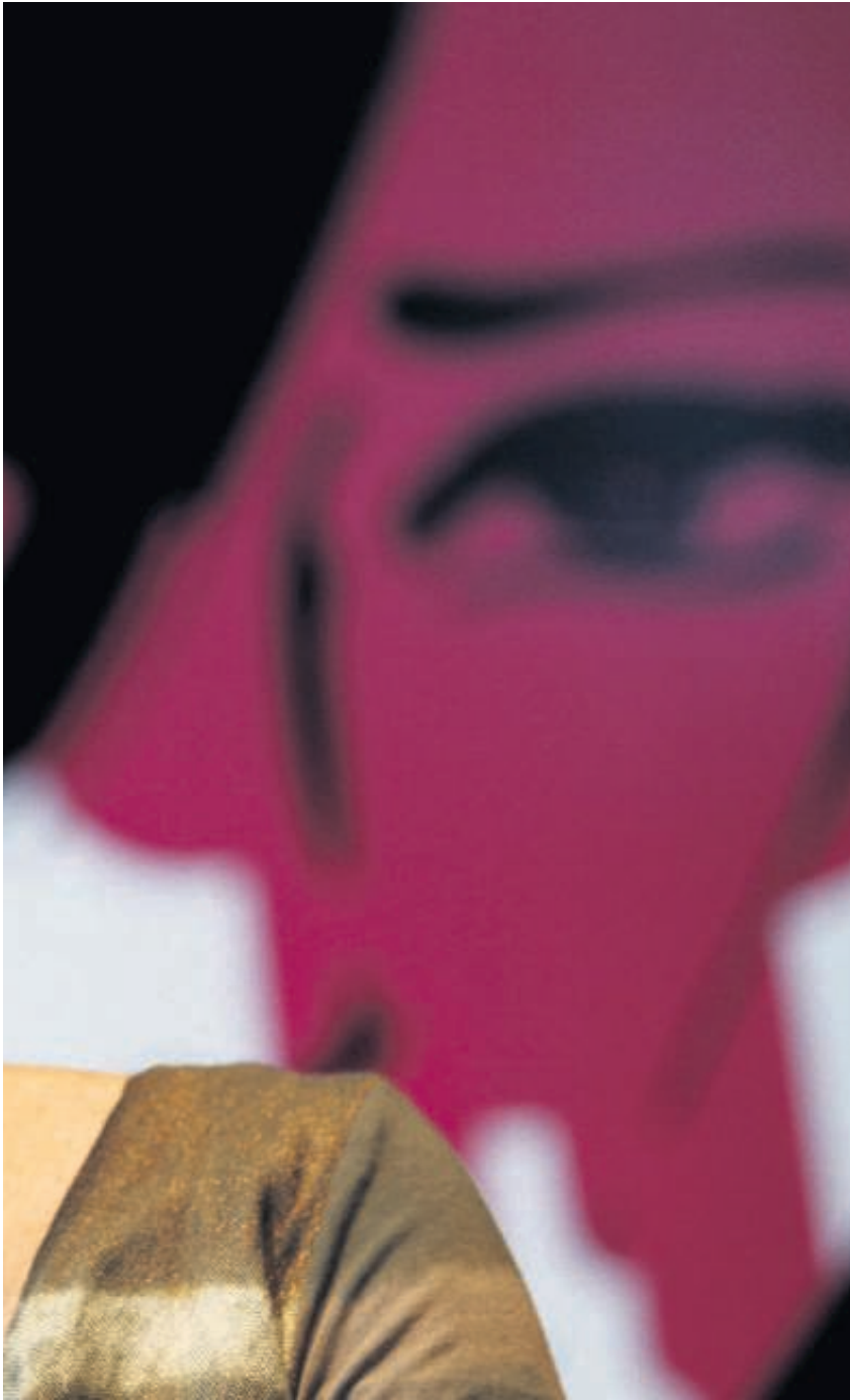
est « indispensable de créer un grand ministère des Droits de la femme ».