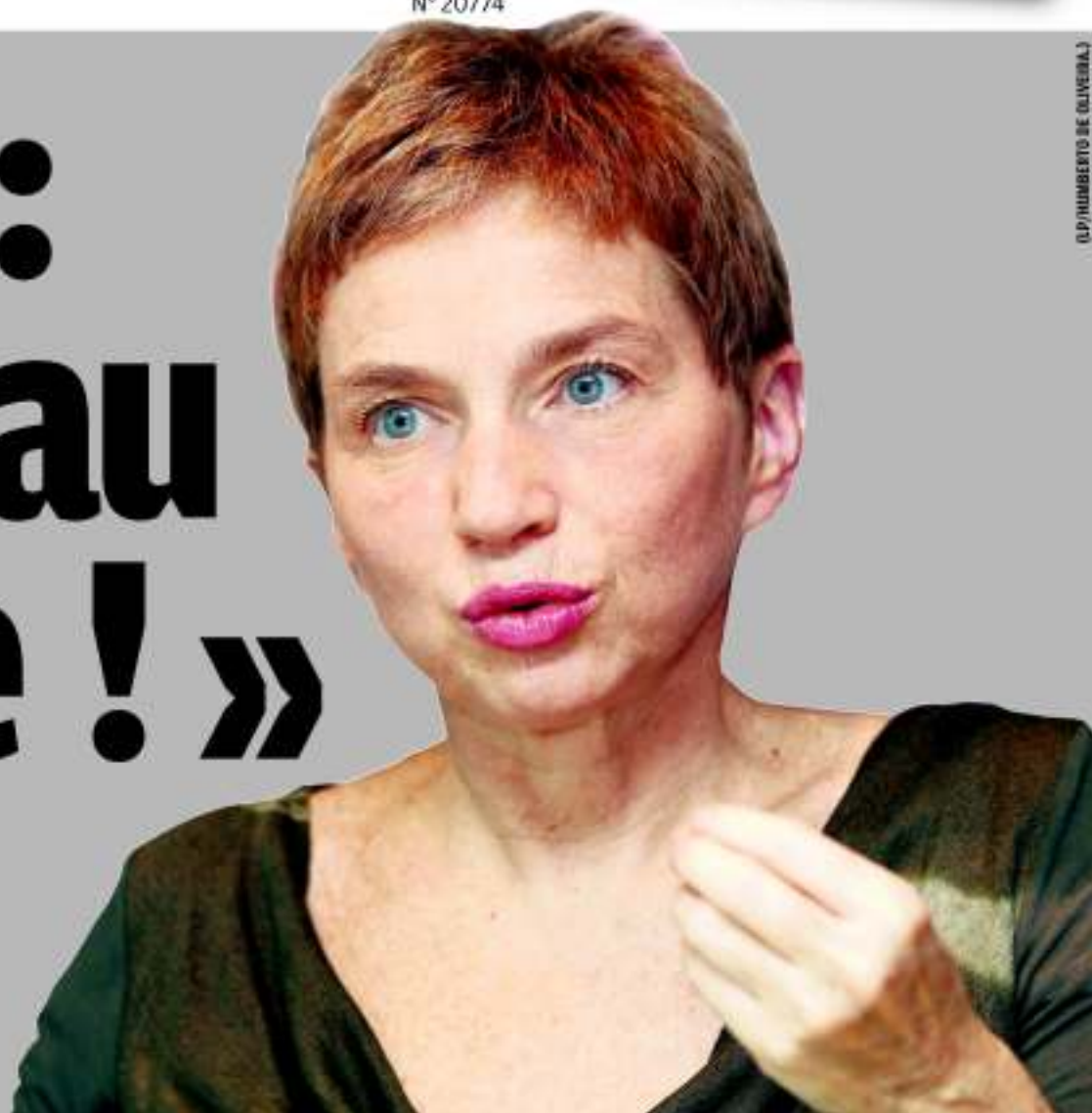
(D.P./NUMBERTO DE OLIVEIRA)