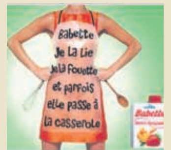
Humour ou pas, les publicités à caractère sexiste font débat.

En tant que présidente du Medef, je suis amenée à travailler avec des ministres. Les relations de travail avec les ministres femmes sont presque toujours plus faciles et plus constructives qu'avec les ministres hommes. Les hommes instaurent plus volontiers des relations de domination. De façon beaucoup plus générale, il y a un problème quand on confond subordination et séduction.